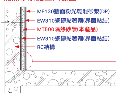
隔熱砂漿施工大樣圖